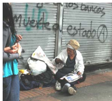
Bogotá, Junio de 2011

¿Qué se podrá esperar entonces, cuando se anuncia una nueva crisis económica mundial? Una vez más tendríamos que insistir en que no pocos problemas de la vejez dependen de cómo se haya dado el trascurso de la vida, en un contexto socio-cultural, político y económico.