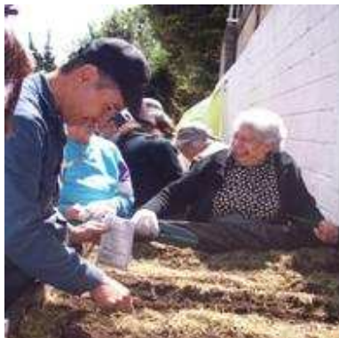
FOTO 1 y 2. SIEMBRA EN CAMAS Y SEMILLEROS

Para los diseños de huerta para los solares productivos, se tuvo en cuenta los espacios seleccionados para los mismos, es decir, si era zona dura (sobre concreto) o si era zona blanda (sobre terreno) con base en las características de los Hogares se realiza un diseño con camas de siembra en madera forradas con plástico negro calibre 6 (las camas de siembra son estructuras forradas que sirven de medio de siembra en espacios reducidos y/o para personas con algún tipo de discapacidad física, evitando que se generen grandes esfuerzos), dichas camas tenían 3 tipos de alturas: 1 mt. 80 cm. Y 60 cm. estas alturas estaban seleccionadas en concordancia con la estatura promedio de las personas mayores y de las personas en silla de ruedas; para los semilleros (contenedores empleados para la germinación y emergencia de las plántulas), se emplearon las camas de madera, botellas plásticas, canastillas forradas, recipientes plásticos y sobre el mismo terreno; Ver FOTO 1 y 2.