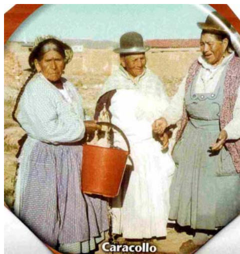
Miembros de la organización de “Achachis”