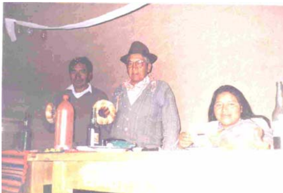
Entrega de equipamiento para el taller de cerámica a la Organización “Cayllachuru” Comunidad Ancasi por el Presidente de la Red C.R.O.