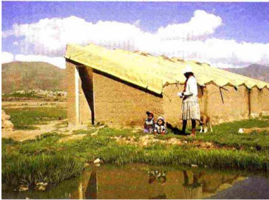
Construcción de Módulo productivo