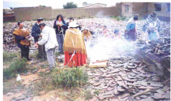
Ch!alla (Ritual en agradecimiento a la Sede) en la fiesta de Carnavales organización “Achachis” de Caracollo