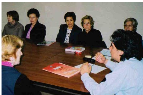
Relator y Dirigentes de Clubes, 2007.

Capacitaciones. Y, la hipótesis de acción táctica es: