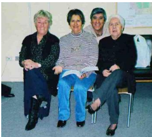
(Directorio UCCAM Santiago 2007)

El primer paso dado por los dirigentes en el Modelo de Intervención, se identifica con el logro del Auto Diagnóstico Organizacional. Periodo que da comienzo al Proyecto “Fortaleciendo los Clubes”. Consistió en discusiones del Directorio de la UCCAM, sobre el estado participativo de sus socios, su realidad organizacional, comunicacional y formativa, respecto de “deberes y derechos” de las personas mayores.