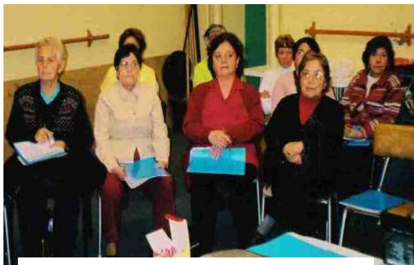
Dirigentes de clubes, sede comunitaria, 2007

de la propuesta de los profesionales en torno a la fundamentación de la situación del estado de la participación social en un contexto de envejecimiento y modernidad como complejidad leída desde la Política de Vida (Giddens: 2000).