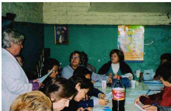
Vice Presidenta UCCAM y Dirigentes de clubes, 2007.

En este período los dirigentes del Directorio logran llevar a cabo una permanente formación y educación de sus socios en los temas que incluye el ciclo. Cubriendo aproximadamente el 60% de los clubes. Los actores partícipes en esta etapa, son permanentemente todos los dirigentes, tanto de UCCAM como de Clubes y los profesionales. El Directorio planifica y diseña el cronograma de trabajo y los dirigentes de clubes dispondrán las sedes comunitarias para llevar a cabo las actividades de formación. A su vez, Los Agentes técnicos acompañan este período con actividades de supervisión del